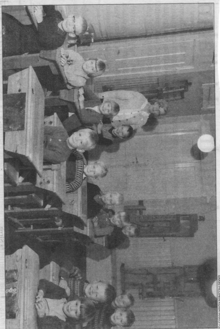
ERIKI HEIJNIN KUVA-ARSTIO

Vielä 1920-luvulla hyvin tuntuun perimätiedon mukaan uluisa rosvo Hattulan Janne ki Martinorpan takaiseen paininammäkeen muura-ispesään ison kannullisen