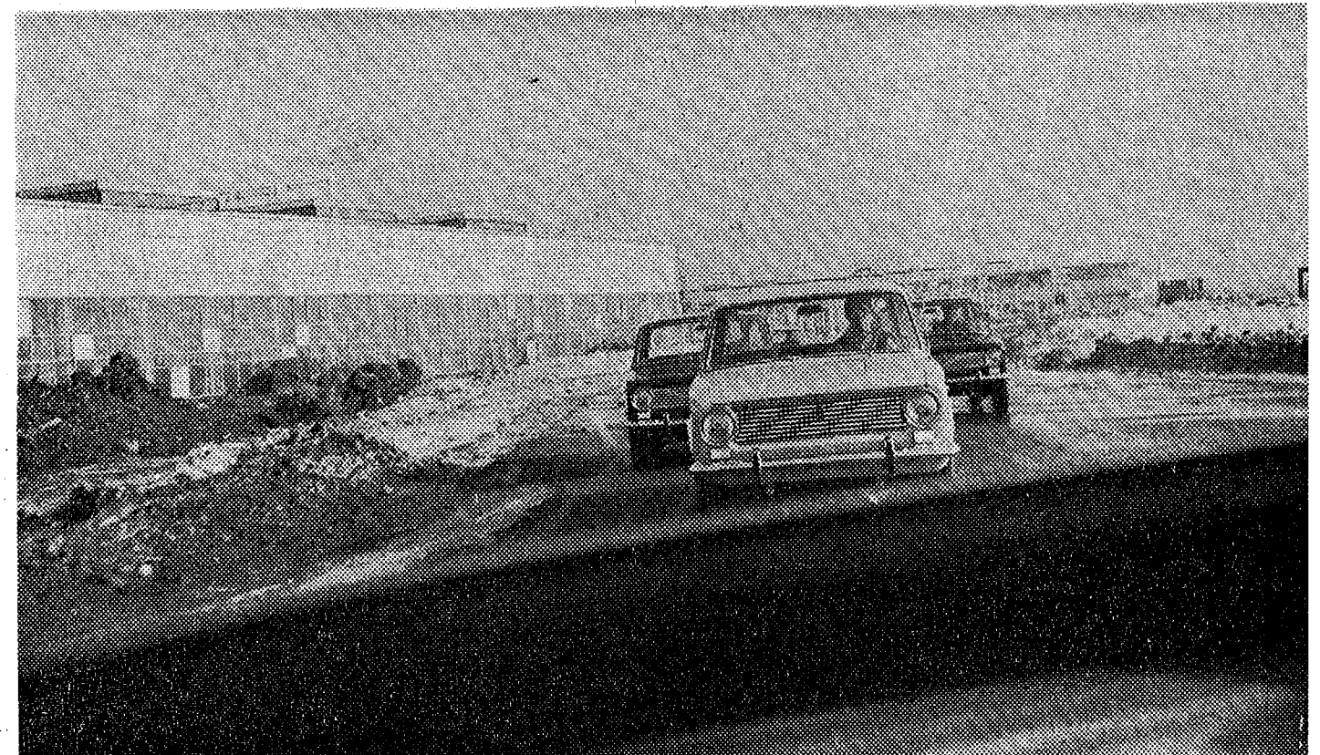
Uunituoreet Ladat joutuvat liukuhihnalta koeajettaviksi tehtaassa koeajoradalla.

Togliattin kaupunki on tunnin ja neljän- kymmenen minuutin lentomatkan päässä Moskovasta — tai kymmenen tunnin ajo- matkan päässä, jos alla on tehtaan oma tuote, sikäläisen automaailman ylpeys: neuvostofiat, joka kotimaassaan tunnetaan Zhigulina, länsimaissa Ladana.