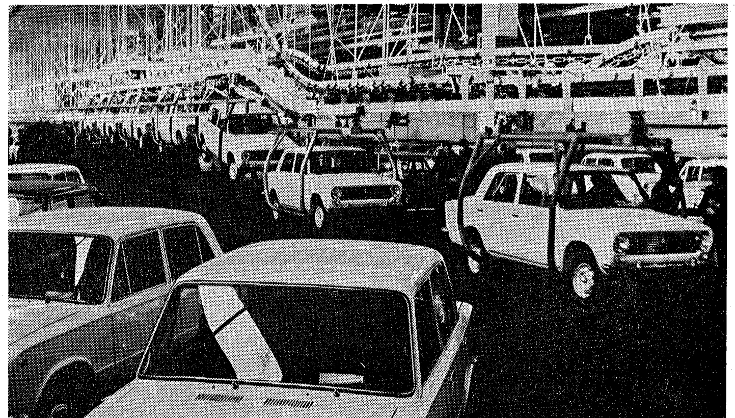
Ladoja tehdään nyt 850 auton päivävauhtia; kolmannen linjan valmistuttua on luku 2000.