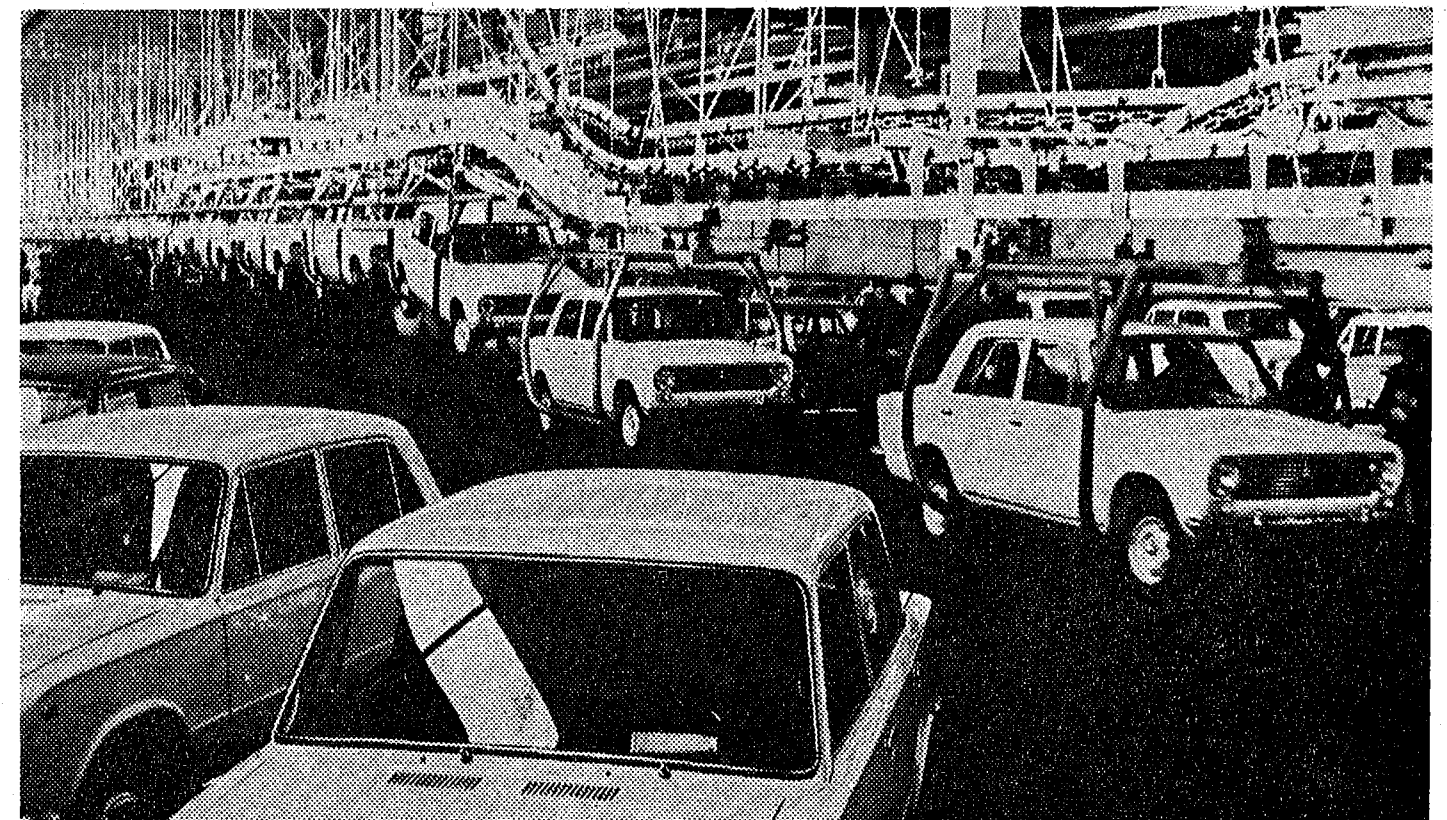
Ladoja tehdään nyt 850 auton päivävauhtia; kolmannen ilnan valmis tuttua on luku 2000.

Togliatti on saanut nimensä edesmenneen italialaisen kommunistijohtajan Palmiro Togliattin mukaan. Autotehtaan Togliatti sai kuitenkin puhtaasti muista ansiosta: se voitti sadan muun halukkaan paikkakunnan kilpailussa tehtaan sijoituspai- kasta, koska pystyi tarjoamaan parhaat edut kuljetus-, voimava- ra- ja työvoimakysymyksessä. Tietokone ratkaisi.